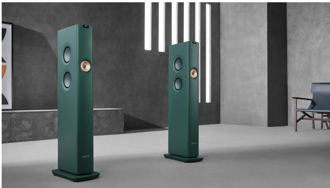
KEF LS60 Wireless Lotus Edition

金山科技副董事總經理、KEF Audio Group 總裁兼全球市場部主管羅潔怡表示：「我們樂見 KEF 與 Lotus 的長期合作，除印證 KEF 在音響技術上的雄厚實力，亦促進跨行業的互動。基於深厚的合作關係和追求極致使用體驗的共同目標，我們期待與 Lotus 繼續探索各種業務之間的合作與協同效應，延伸至不同範疇，融入各種生活空間，進一步提升品牌形象和競爭力，為 KEF 及金山科技集團提供高質量發展動力。」